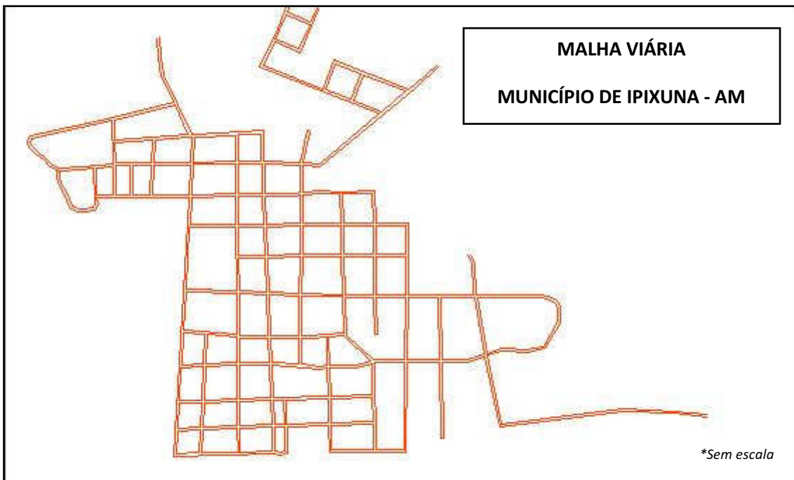
Foto 02. Quadro das avenidas e ruas do município de IPIXUNA/AM abrangidas no projeto de limpeza.