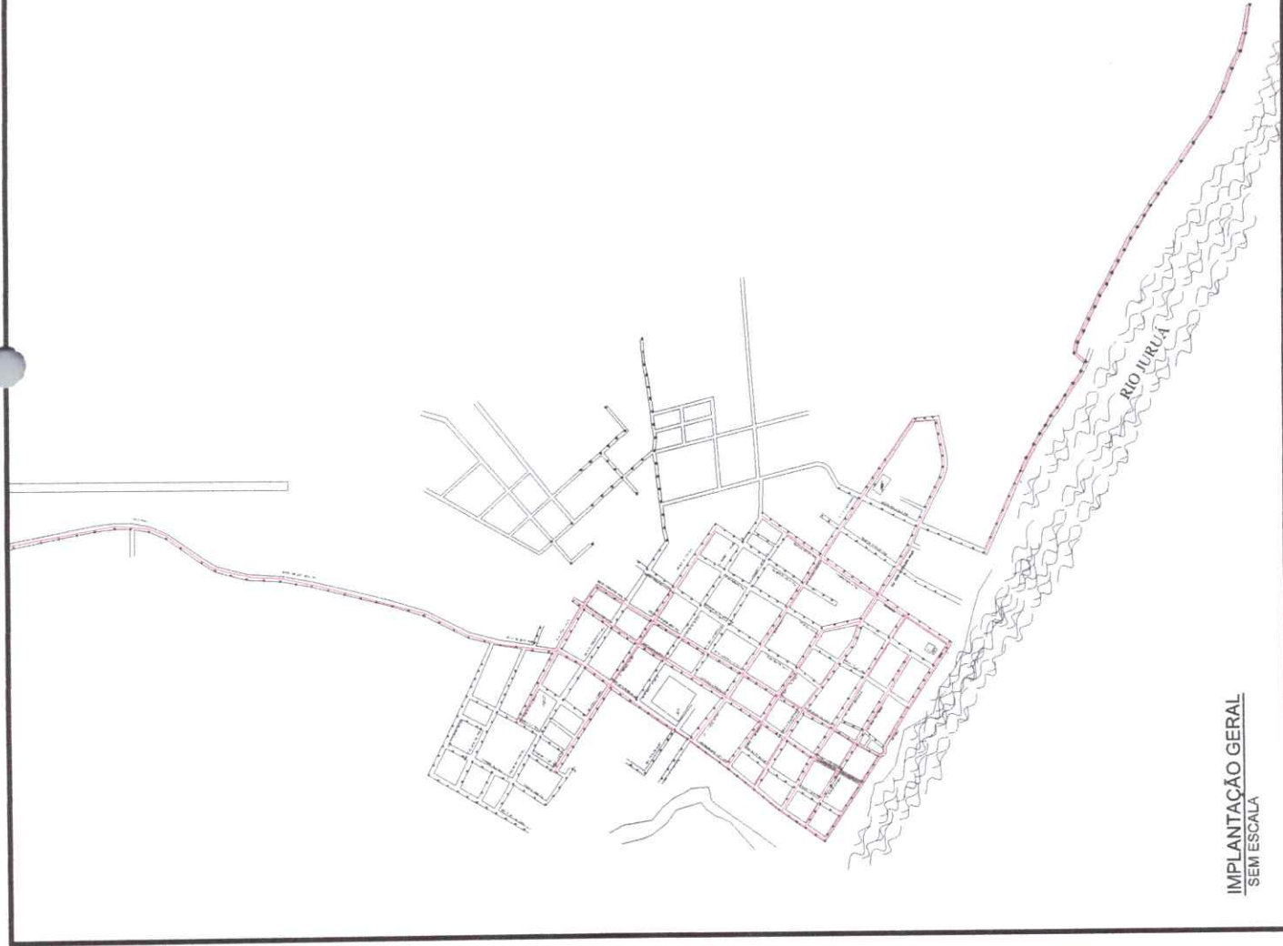
IMPLANTAÇÃO GERAL SEM ESCALA