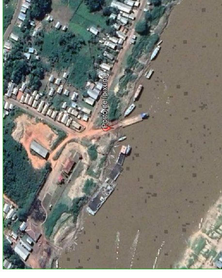
IPIXUNA/AM - Porto

Jhames R. Medeiros Engenheiro Civil CREA 0203-0/MAM