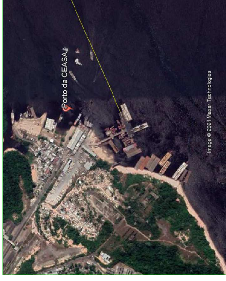
Manaus/AM - Porto da CEASA