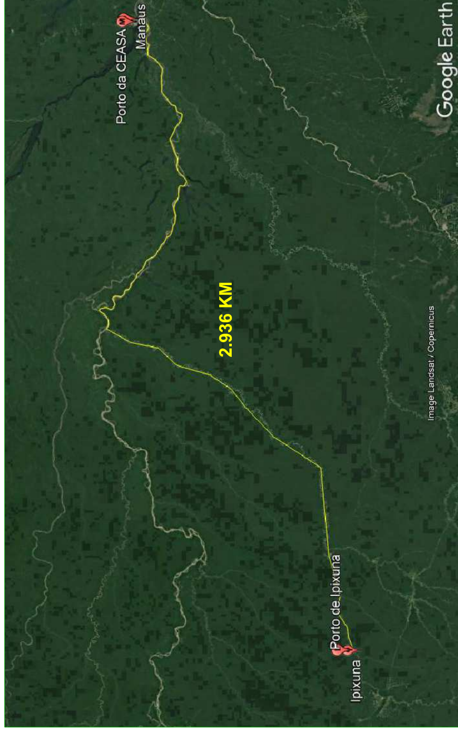
Distância Via Fluvial: 2.936 KM